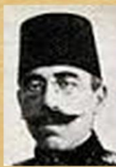
1920 Salih Hulusi Paşa

3 Mart 1920 A.Rıza Hükümeti istifa etti.