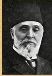
1918 - 1919 Sadrazam Ahmet Tefik Paşa