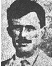
Binbaşı Edward Noel

Sivas Kongresi'ni engelleme çalışmaları yapmak için Anadolu'ya gönderilen;