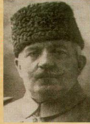
1918 Sadrazam Ahmet İzzet Paşa