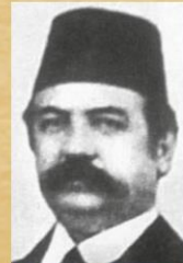
1920 Sadrazam Damat Ferit