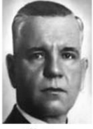
Ali Fuat Cebesoy

Öncelik Ulusal Bağımsızlık Daha sonra Ulusal Egemenlik amaçlandı.