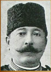
1920 Ali Rıza Paşa

Sivas Kongresi sonrası Damat Ferit istifa etti