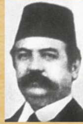
1919 Sadrazam Damat Ferit

Mustafa Kemal, Samsun'a çıkar- ken Damat Ferit Hükümeti vardı