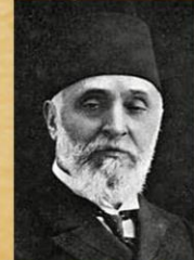
1920 - 1922 Sadrazam Ahmet Tefik Paşa