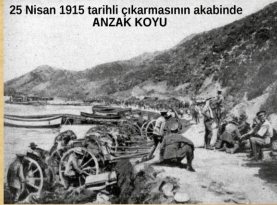
25 Nisan 1915 tarihli çıkarmasının akabinde ANZAK KOYU