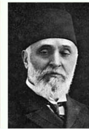
1918 Sadrazam Ahmet Tefik Paşa