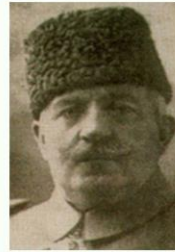
1918 Sadrazam Ahmet İzzet Paşa