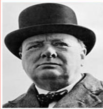
Winston Churchill 1874 - 1965

Garden Planı: İtilaf Devletlerinin Çanakkale'yi geçme planı