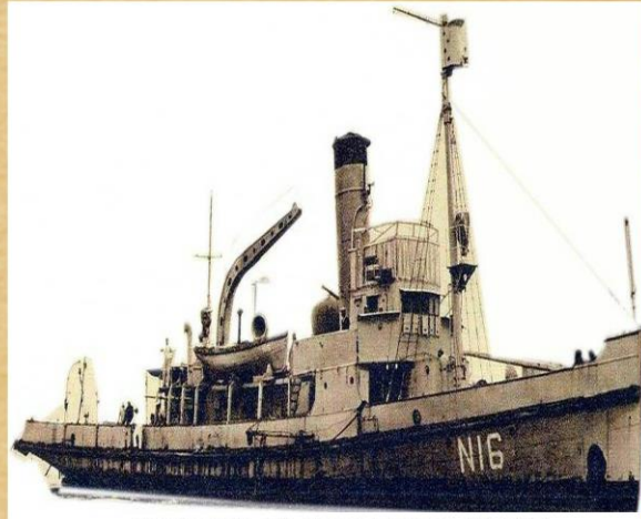
Mucizenin adı Nusret Mayın Gemisi

İtilaf devletleri, saldırıyı 18 Mart'ta gerçekleştirdi. Hedef, Çanakkale Boğazı'nın sadece 1 mil genişliğindeki en dar noktasıdır