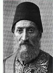
1912 Sadrazam Kibrılı Kamil Paşa

Mondros Ateşkes Antlaşması; - VI. Mehmet Vahidettin dönemi - Ahmet İzzet Paşa Kabinesi tarafından imzalandı.