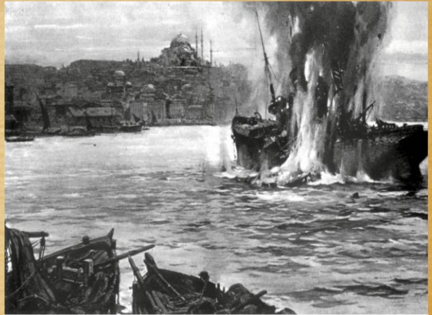
Birleşik Krallık denizaltısı E11, İstanbul Boğazında Osmanlı nakliye gemisi Stamboul'a torpidoyla saldırırken, (25 Mayıs 1915)

Bahriye Nazırı Churchill II. Dünya Savaşında 66 yaşında İngiltere'nin Başkanı olacaktır. 1953'te Nobel Edebiyat Ödülünü aldı. 1955'te tekrar seçildi. 91 yaşında öldü.