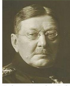
Colmar Von der Goltz mişti:

Osmanlı kolordusunu tutacak ve çevirme harekâtının bir kanadı hedefine geç ulaşacak