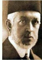
1913 Sadrazam Sait Halim Paşa