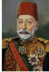
V. Mehmet Reşat 27 Nisan 1909 3 Temmuz 1918

I. Dünya Savaşı başladığındaki hükümet; 1913 Sadrazam Sait Halim Paşa