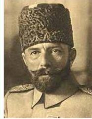
Cemal Paşa 1872 - 1922

Kanal Cephesinde İngilizlere karşı mücadele eden Bahriye Nâzırı Cemal Paşa