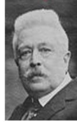
Vittorio Emanuele Orlando