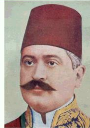
1917 Sadrazam Talat Paşa