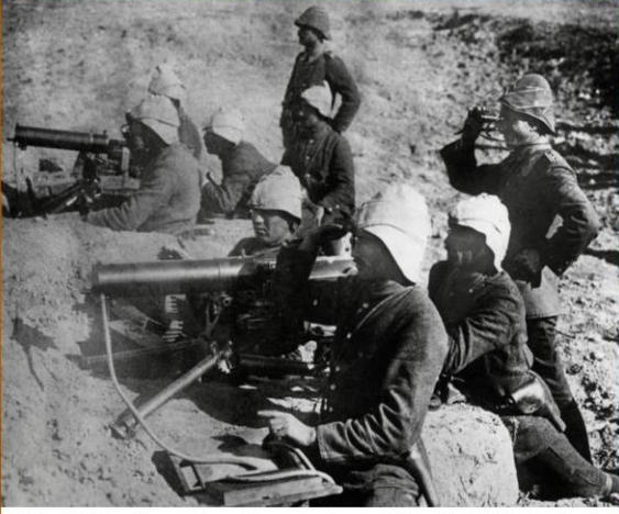
MG 08 ile donatılan Osmanlı makineli tüfek timleri.