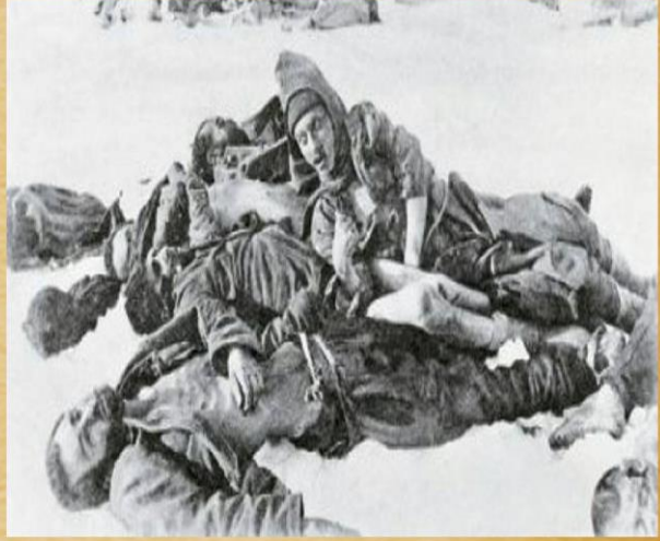
Sarıkamış Şehitlerimiz :(