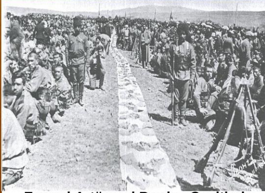
Ermeni 4. tümeni Barduz Geçitinde

gemilerine rast gelmiş ve onları batırmıştır. Bunun yanında Derne Gemisinin (4000 Tonluk) Ruslar tarafından batırılması ordunun erzaksız kalmasına neden oldu.