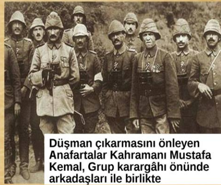
Düşman çıkarmasını önleyen Anafartalar Kahramanı Mustafa Kemal, Grup karargâhı önünde arkadaşları ile birlikte

7 Aralık 1915 'te Müttefikler Gelibolu'yu tahliye ettiler.