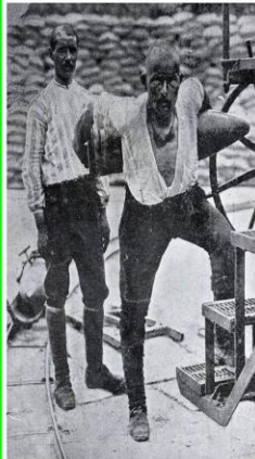
Seyit Onbaşı 1889 - 1939

Çanakkale'de Rumeli Mecidiye Tabyası 'nda görevliydi. Topun mermi kaldıran vincinin kırılmasıyla 270 kiloluk top mermisini sırtlayarak top kundağına yerleştirdi.