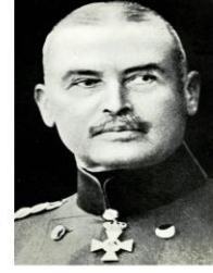
1918'de Şeria Muh. sonra Liman Von Sanders