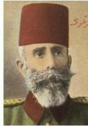
1913 - Sadrazam Mahmud Şevket Paşa