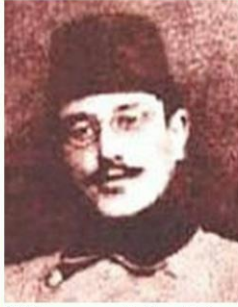
Süleyman Askeri Bey

1915 Selmanpak Muharebesi 1916 Kut'ül Âmare, (Sabis Meydan Savaşı)