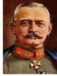
1917'de Falkenhayn Yıld.Ord.Kom.