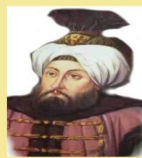
II. Ahmet (1691 - 1695)