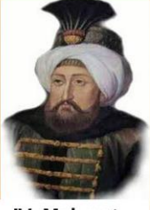
IV. Mehmet (1648 - 1687)