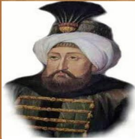
IV. Mehmet (1648 - 1687)