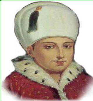
II. Osman (Genç Osman) (1618 - 1622)

Amacı İlmîyenin devlet yönetimine karşımasını engellemek