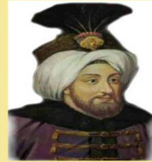
II. Mustafa (1695 - 1703)