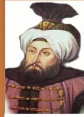
II. Ahmet (1691 - 1695)

Osmanlı İmparatorluğu ile Avusturya orduları arasında, 11 Eylül 1697 tarihinde Tisa Irmağı kıyısındaki Zenta'da yapılan ve Osmanlıların yenilgiyle sonuçlanan muharebedir. 16 yıl süren Osmanlı - Kutsal İttifak Savaşlarının son önemli çarpışması olan bu savaşın ardından 1699 yılında Karlofça Antlaşması imzalandı.