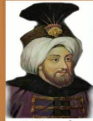
II. Mustafa (1695 - 1703)