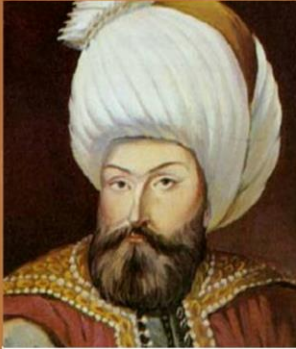
III. Murat (1574 - 1595)