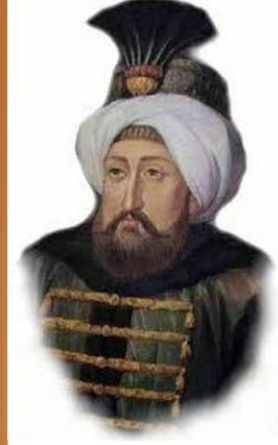
IV. Mehmet 1648 - 1687