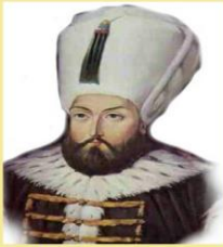
I. Mustafa (1617 - 1618)(1622 - 1623)