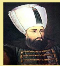
Sultan İbrahim (1640 - 1648)