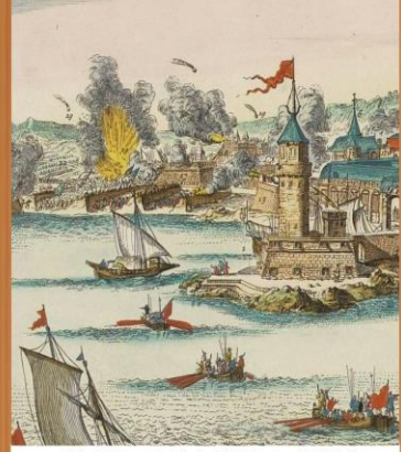
Girit'in Fethi (1645 - 1669)

II. Bayezit döneminde boy ölçüşecek hale geldik (İnebahtı, Modon, Koron ve Navarin kaleleri alındı)