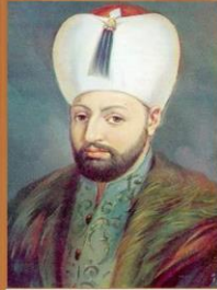
I. Ahmed (1603 - 1617)