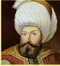
III. Murat (1574 - 1595)