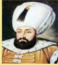
III. Mehmed (1595 - 1603)