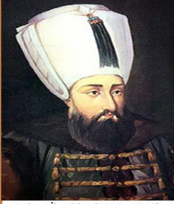
Sultan İbrahim (1640 - 1648)