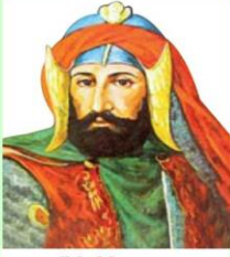
IV. Murat (1623 - 1640)