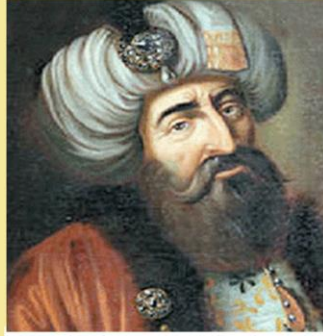
Merzifonlu Kara Mustafa Paşa