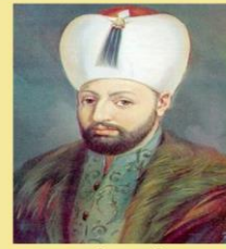
I. Ahmed (1603 - 1617)