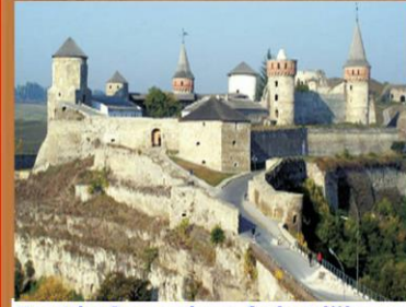
Batı'da Osmanlının fethettiği son Kale Kamanıç Kalesi

XVIII. yüzyılda en fazla savaştığımız devlet Rusya