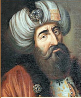
Merzifonlu Kara Mustafa Paşa