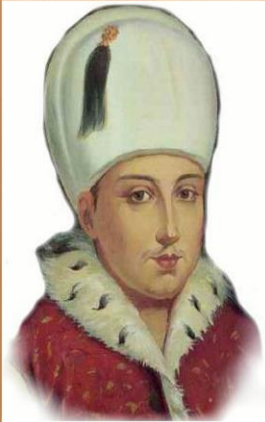
II. Osman (Genç Osman) (1618 - 1622)