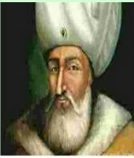
Kuyucu Murat Paşa