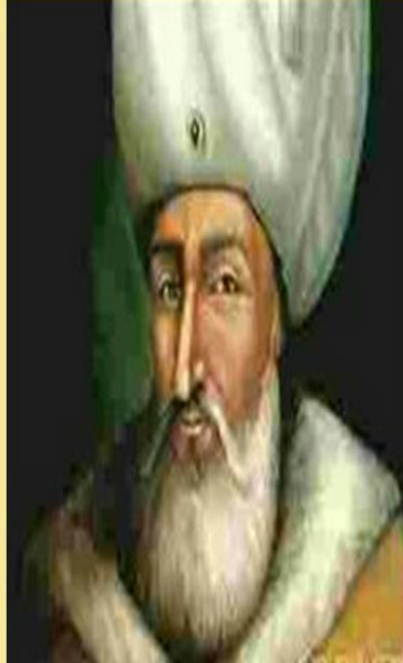
Köprülü Mehmet Paşa

Tarhuncu'dan sonra işbaşına gelenlerin başarısızlığı üzerine Valide Turhan Sultan'a Vezir Köprülü Mehmet Paşa tavsiye edildi.