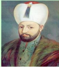
I. Ahmed (1603 - 1617)

I. Ahmed'in sadrazamı olarak görev yaptı. Anadolu'da çıkan isyanları şiddete dayalı bastırdı