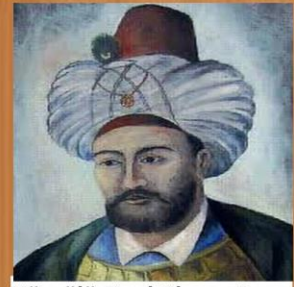
Köprülü Fazıl Ahmet Paşa