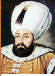
III. Mehmed (1595 - 1603)