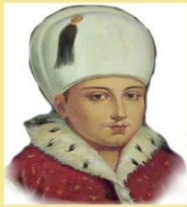
II. Osman (Genç Osman) (1618 - 1622)