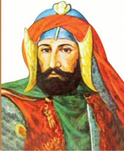
IV. Murat 1623 - 1640 II. Bağıdat Fatih