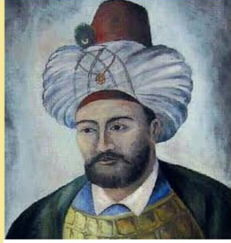
Köprülü Fazıl Ahmet Paşa