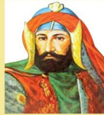
IV. Murat (1623 - 1640)