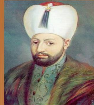
I. Ahmed (1603 - 1617)