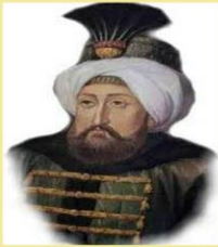
IV. Mehmet (1648 - 1687)